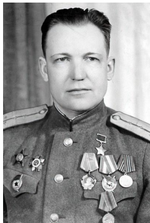
Михаил Денисович Капустин (1907 — 1968)

Улица Капустина названа в честь Героя Советского Союза, протянулась от улицы Степной до улицы Дальней в северной части города.