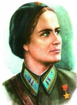
Марина Михайловна Раскова (1912 — 1943)

Улица носит имя Героя Советского Союза Расковой Марины Михайловны. Находится в северной части города, протянулась от улицы Дарвина до улицы Партизанской, а затем с небольшим смещением до улицы Степной.