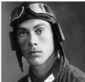
Николай Францевич Гастелло