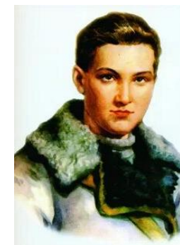
Зоя Анатольевна Космодемьянская