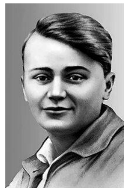
Олег Васильевич Кошевой