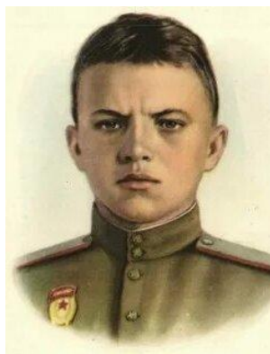
Александр Матвеевич Матросов